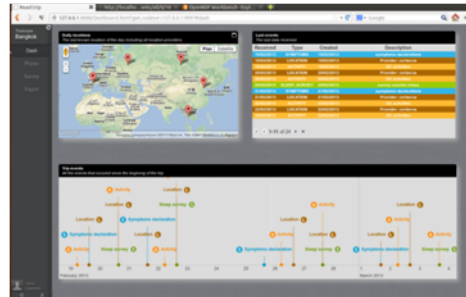
Application web sur ordinateur