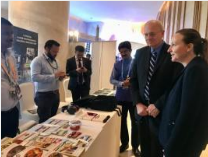
Discours par le Président du CNES et visite des stands par le Cnes et MEDES